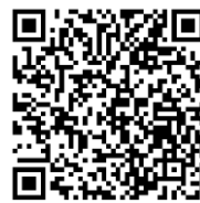
桃園市國民小學藝術才能美術班 鑑定線上報名系統