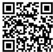
桃園市國民小學藝術才能美術班 鑑定線上報名系統